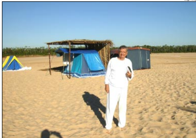
O autor desfrutando das belezas do rio Araguaia

Ainda indecisos onde se instalarem encontraram, em maio de 1897, com um explorador francês, a serviço do governo do Pará, Sr. Henri Coudreau, que subia o Araguaia e este lhes prestou preciosas informações topográficas da região; conti-